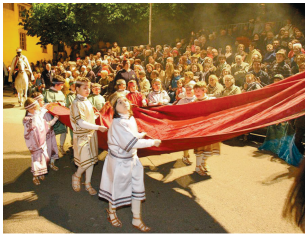
Nella foto d'archivio, i portamanto... al lavoro.

Gli organizzatori comunicano anche di aver raggiunto un accordo per garantire l'apertura delle chiese di San Giovanni e Santa Maria il Sabato santo, la Domenica di Pasqua e il Lunedì dell'Angelo dalle 10 alle 18. Come già negli ultimi anni gli interessati potranno inoltre ammirare da vicino i costumi della processione del Giovedì santo, esposti nel gazebo allestito nel cortile di San Giovanni da lunedì 26 a mercoledì 28 marzo. Prosegue intanto la ricerca dei 6 lacché mancanti (interessati possono chiamare il nr 091 646.63.21) e di 4 portamanto (ragazzini di 7/8 anni) disposti a reggere, con altri coetanei, lo strascico di Re Erode.