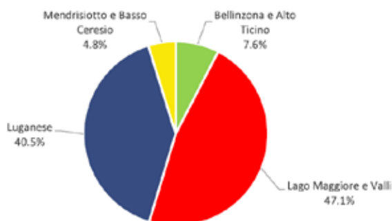
FIGURA 4: ripartizione dei pernottamenti in Ticino per OTR, anno 2017.