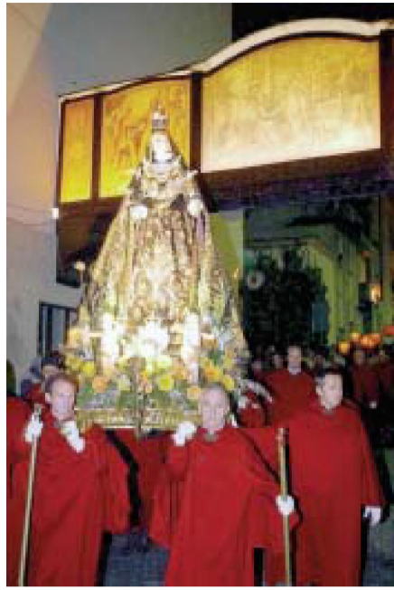
L'Addolorata sfilata per le vie del borgo.

no, a cercare la sua giusta ubicazione. Un lavoro organizzativo enorme, ricompensato solo dall'ammirazione e dall'emozione che la sfilata genera, ogni anno, sia in chi la vede per la prima volta, sia in coloro che a questo spettacolo assistono con regolarità. Ricordiamo inoltre, che nella chiesa di Santa Maria, come tradizione vuole, è stato allestito il Santo Sepolcro e che in Chiesa Parrocchiale sono esposti i trasparenti originali del Bagutti. I simulacri del Cristo morto e dell'Addolorata, che stasera verranno portati a braccia in processione, si trovano invece nella Chiesa di San Giovanni. Comuniciamo infine che chi volesse assistere alla processione dalla tribuna ubicata in Piazza del Ponte, che i posti possono essere acquistati alla roulotte posta nella stessa Piazza e aperta anche oggi fino alle 23.