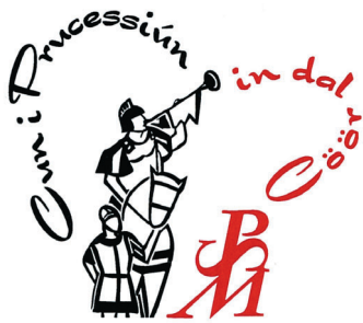
Il logo che ha accompagnato le iniziative che si sono concretizzate lo scorso mese di marzo.

I fattori fondamentali sono stati tre: tematica, organizzazione e partecipazione. Tre elementi che hanno concorso al successo dell'evento. Il coinvolgimento degli artisti si è rivelato un altro ingrediente sostanziale per la riuscita del progetto. L'asta ha contribuito grandemente a far lievitare la cifra raccolta a favore della Fondazione Processioni Storiche e ha consentito di far conoscere il lavoro qualitativamente elevato di artisti della nostra regione che sono volentieri a disposizione di coloro che hanno acquistato le opere esposte.