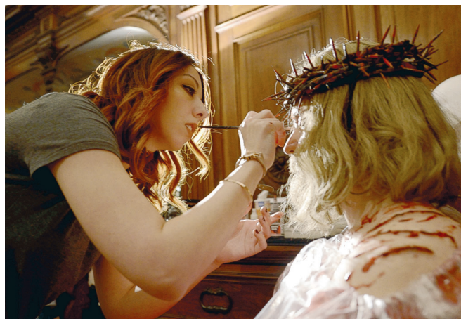
Alcune immagini della Processione del Giovedì Santo, fatta rientrare anzitempo a causa di pioggia e grandine.