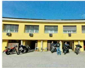
Hotel Vezia, Vezia