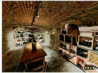
Locanda San Silvestro, Meride