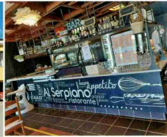
Hotel Al Serpiano, Serpiano