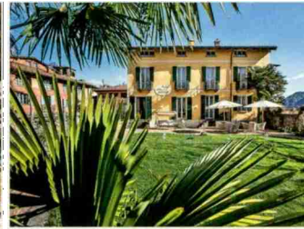
Hotel Villa Carona, Carona

Morbio Inferiore – le parc des gorges de la Breggia est intéressant géologiquement et du point de vue de la paléontologie. Ses falaises sont âgées de centaines de millions d'années.