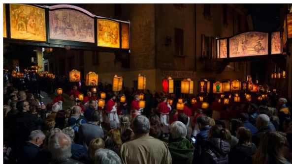
Elemento centrale: i trasparenti