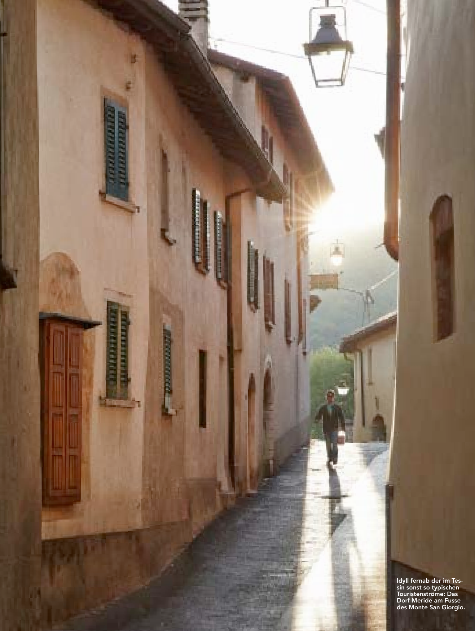
Idyll fernab der im Tes- sin sonst so typischen Touristenströme: Das Dorf Meride am Fusse des Monte San Giorgio.