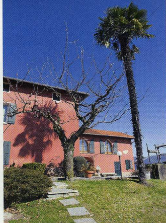
Das Gut Monticello liegt auf dem Hügel von Montalbano.