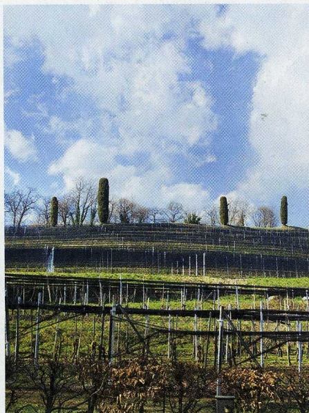
Auf dem Weingut Montalbano fühlt man sich wie in der Toskana.