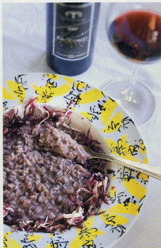
Risotto al Merlot mit Radicchio rosso im Ristorante Montalbano.