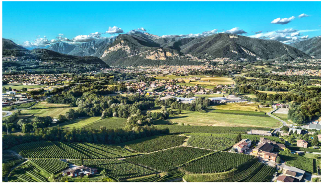
Il territorio del Mendrisiotto

La XXXI edizione del Festival Jazz di Chiasso, al confine fra Italia e Svizzera, ha decretato la nuova sfilata di un pianista dalle sensibilità uniche come Fred Hersch, autentico innovatore anche nell'impiego dei linguaggi più tradizionali. "Segni di Jazz" lo ha quindi scelto come artista residente offrendogli carta bianca per le tre serate con altrettante esibizioni che lo hanno visto prima in soli e poi con due esecutive, ovvero un quartetto con Geoffrey Simcock e un trio affilato completato da Drew Gons e Joey Baron.