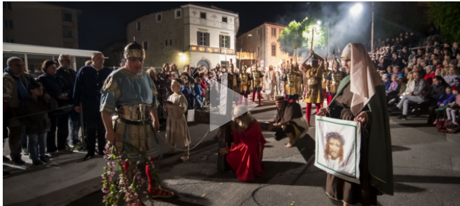
La Processione del Giovedì santo sfila per le vie del Borgo