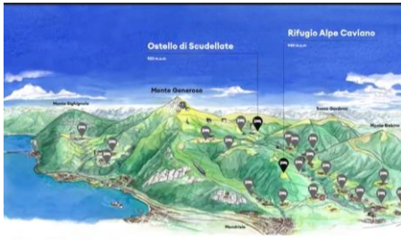
Albergo Diffuso Monte Generoso

Guarda: https://m.youtube.com/watch?v=yTFp-8ixjuI